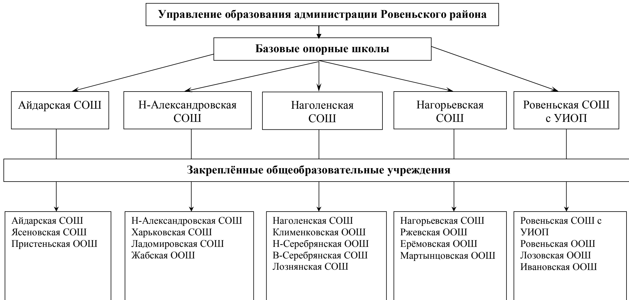
Схема организации предпрофильной подготовки обучающихся в 2015-2016 учебном году